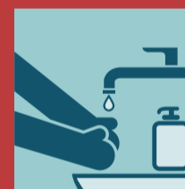
Cuci tangan dan sedia selalu hand sanitizer