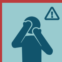
Tangan harus bersih sebelum pegang wajah