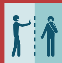
Jaga jarak dengan pasien Coronavirus

Antis Hand Sanitizer adalah pembersih tangan anti kuman tanpa air yang mengandung 70% alkohol dan efektif membunuh kuman dan virus